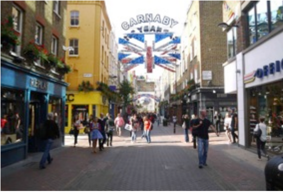
Décor projeté : Carnaby Street