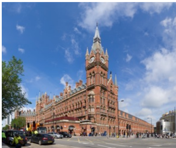
Décor projeté : Dans la rue devant la Gare Saint-Pancras - Londres