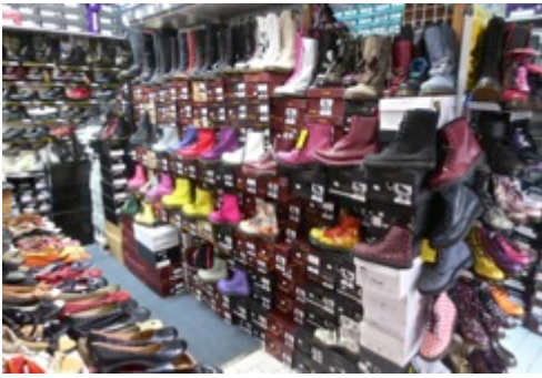
Décor projeté : Magasin de chaussures

Les passants sortent aussi par les deux côtés. NOIR pour installation d'un tabouret et de quelques boîtes à chaussures. FIN AMBIANCE SONORE.