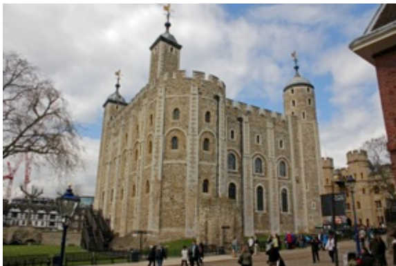
Décor projeté : Tour de Londres