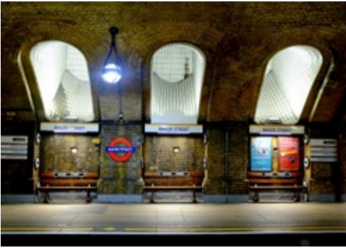
Décor projeté : Station de Métro Baker Street